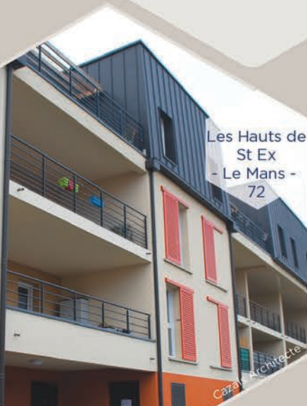
Les Hauts de St Ex - Le Mans - 72