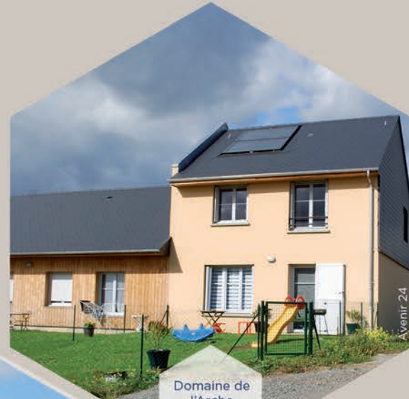
Domaine de l'Arche - Louplande - 72