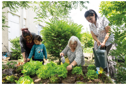
Jardin partagé de Crowborough à Montargis