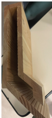
Nid à chauve-souris, le Clos Vinot à Amilly