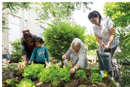
Jardin partagé de Crowborough à Montargis